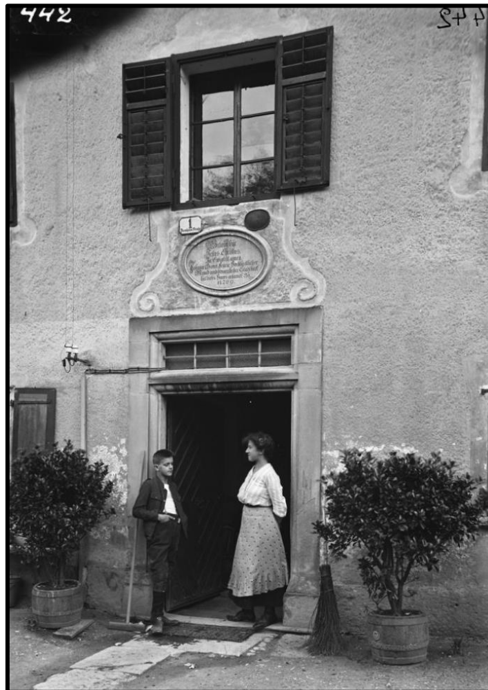
Eingang Stieglhof (Feyerlhof) in Maxglan, vor 1910, Salzburg Museum, GP 2250-49.

Zwölf tausend fünfhundert Gulden ö.W.[österreichischer Währung]“