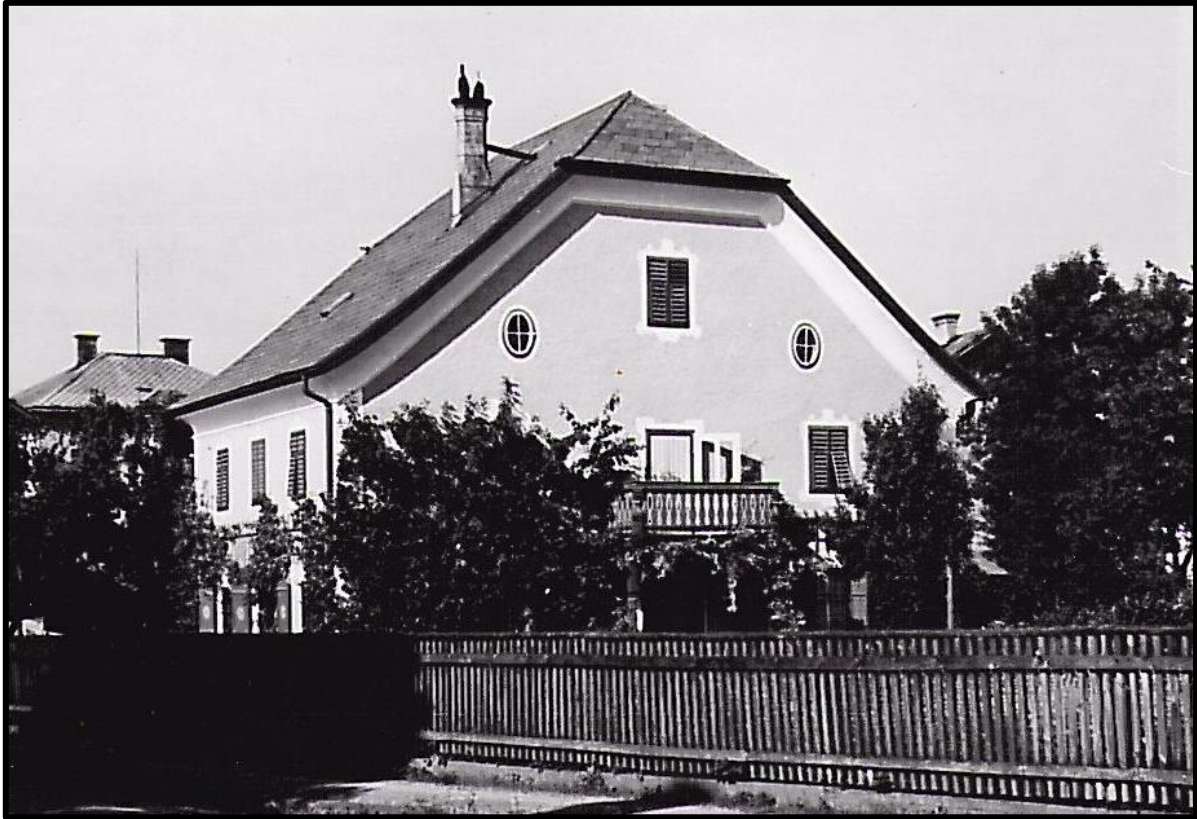
Feyerlhof, ca. 1940, Archiv der Stieglbrauerei.

Gasschleusen an den Ein- und Ausgängen versehen waren. 32 Diese Gräben boten allerdings nur Schutz gegen Bomben- und Flaksplitter. 33