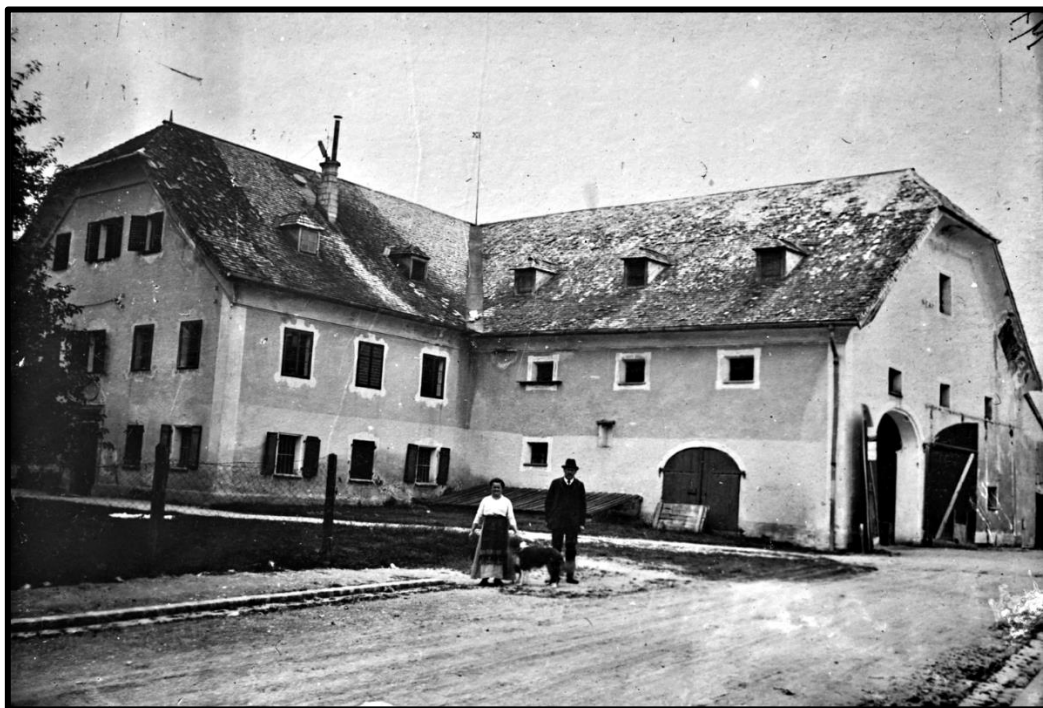
Stieglhof (Feyerthof) in Maxglan, vor 1910, Salzburg Museum, GP 2252-49.

Auf der Nordseite ist ein Flugdach angebracht, unter welchem Leiter und anders Geräte aufbewahrt sind. Gegen Süden liegt der ganz aus Holz hergestellte Abort. Der Bauzustand dieser vorbeschriebenen Baulichkeiten ist ein guter, nur zum geringen Theil ein mittelmässiger.