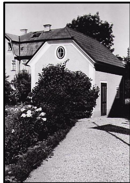
Feyerlhof Nebengebäude, ca. 1940, Archiv der Stieglbrauerei.

Der noch bestehende große Garten des Gebäudes sticht im heute dicht bebauten Salzburger Stadtteil Maxglan hervor und erinnert an die ehemalige Größe des landwirtschaftlichen Gebäudekomplexes.