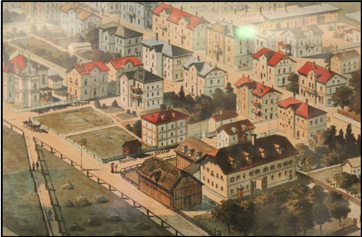
Werbeplakat Maxglan bei Salzburg, Ausschnitt Feyerlhof, um 1900, Archiv der Stieglbrauerei.

Nach dem Tod des Stieglbräuers Joseph Schreiner im Jahre 1880 fand sich unter seinen Erben niemand, der die Unternehmungen der Stieglbrauerei fortführen wollte oder konnte. Begründet liegt dies vor allem darin, dass seine Kinder durchwegs entweder schwer von der Tuberkulose gezeichnet waren oder bereits vor dem Ableben des Joseph Schreiner daran bereits verstorben waren. 18 So entschloss man sich 1882 die Stieglbrauerei samt aller zugehörigen Realitäten inklusive Feyerlhof zu verkaufen. 19